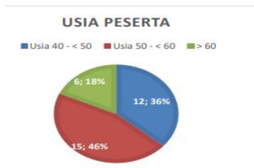
Gambar 1. Sebaran usia peserta pelatihan

Jumlah Peserta yang mengikuti kegiatan 37, beberapa tidak lengkap mengisi kuesioner yang sudah didistribusikan pada peserta dan yang mengisi kuesioner sebanyak 33 orang dengan data demografi sebagai berikut: