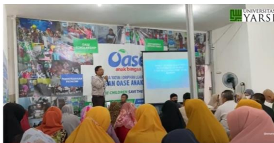
Gambar 2 Suasana pelatihan dan Peserta Pelatihan

Peserta terbanyak berusia 50-< 60 sebanyak 15 orang (29%) , diikuti usia 40-< 50 sebanyak 12 (36 %) dan yang usianya > 60 tahun sebanyak 6 orang (18%).