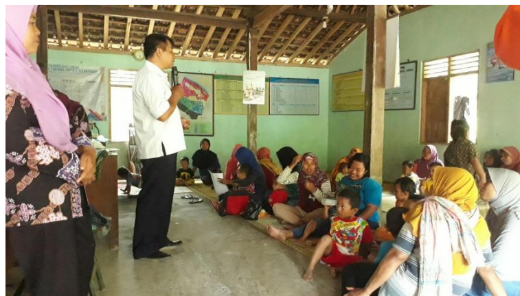
Gambar 2. Penyuluhan PHBS di balai dusun

Ayat tersebut diatas mengandung makna agar seluruh umat manusia selalu dapat menjalani pola hidup sehat. Pola hidup sehat dapat berbentuk kegiatan-kegiatan yang dapat mendatangkan bermacam-macam kebaikan pada diri dan masyarakat serta dan menghindari dari berbagai kegiatan dapat mendatangkan keburukan serta kemaslahatan. Ayat dan hadis di atas juga bukan hanya berupa himbauan namun sekaligus perintah.