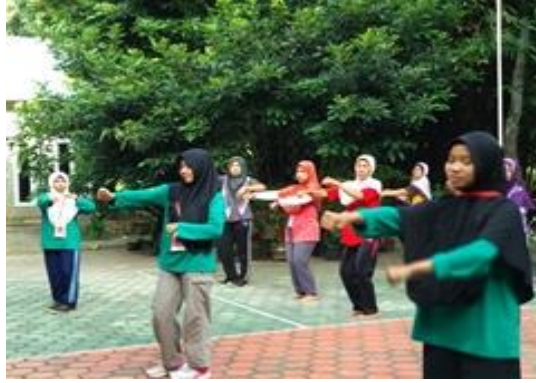
Gambar 1. Senam bersama untuk menjaga kesehatan

Materi tentang PHBS dalam pandangan Islam poin-poin utama yang disampaikan meliputi beberapa hal penting sebagai berikut: